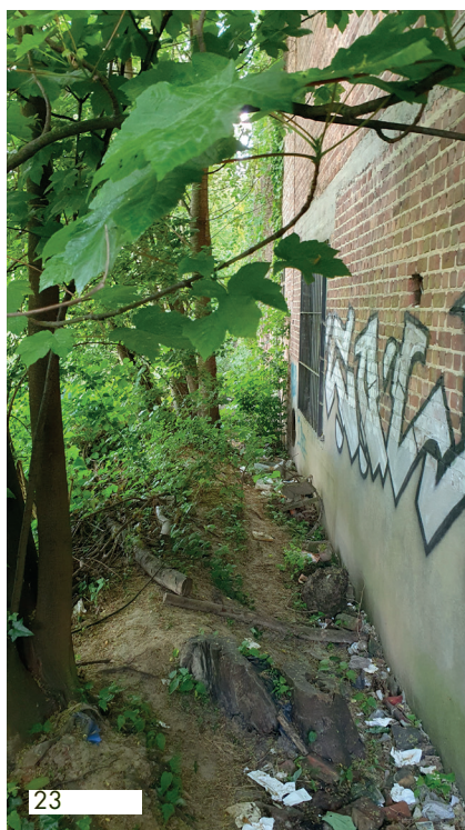
D&C : 06-05-25