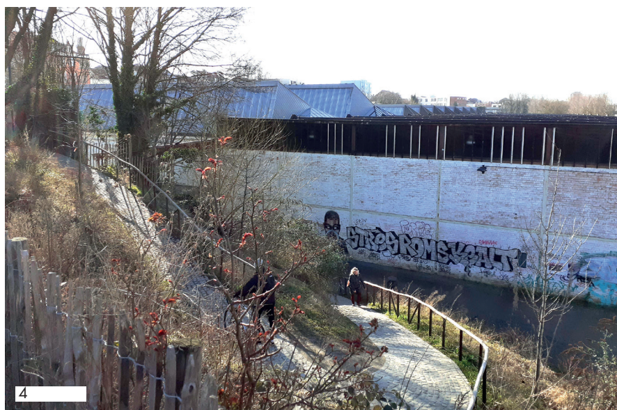
D&C : 12-02-22