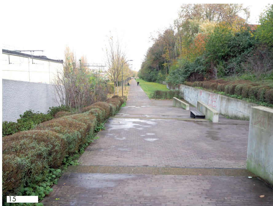
D&C : 12-11-20