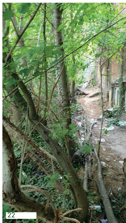
D&C : 06-05-25