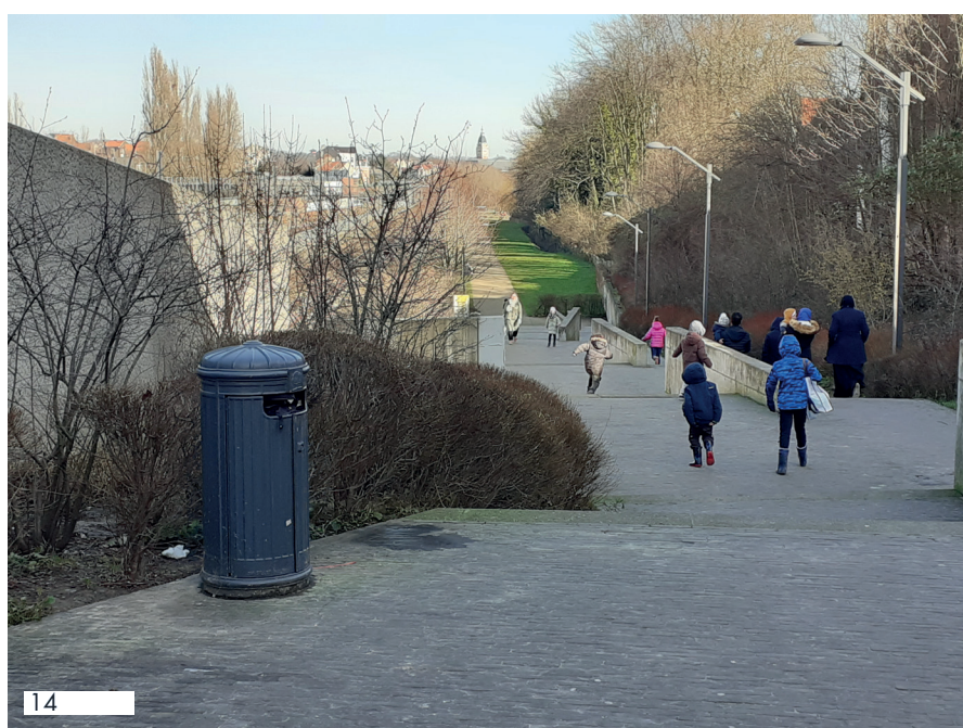
D&C : 12-02-22