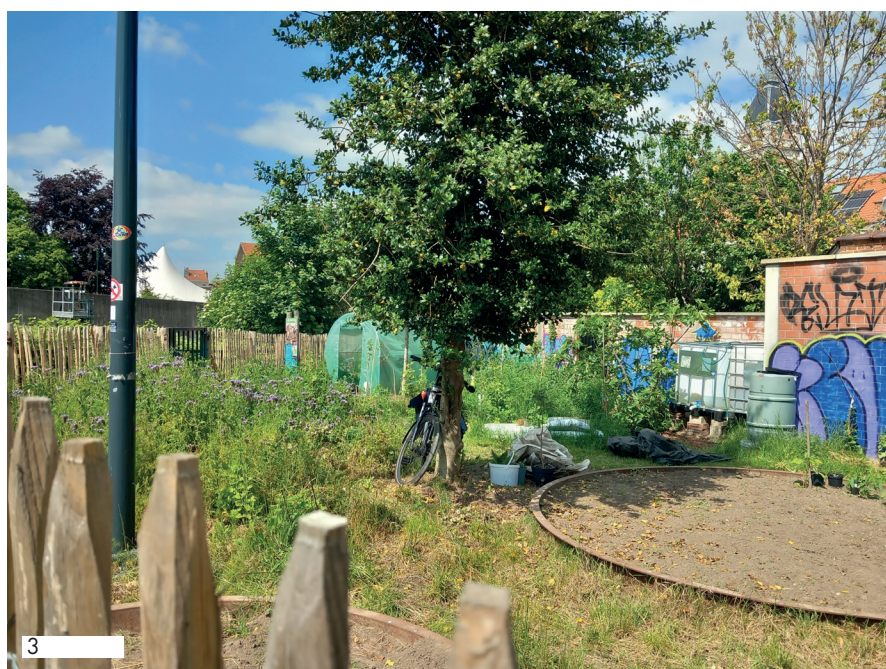
D&C : 25-05-23