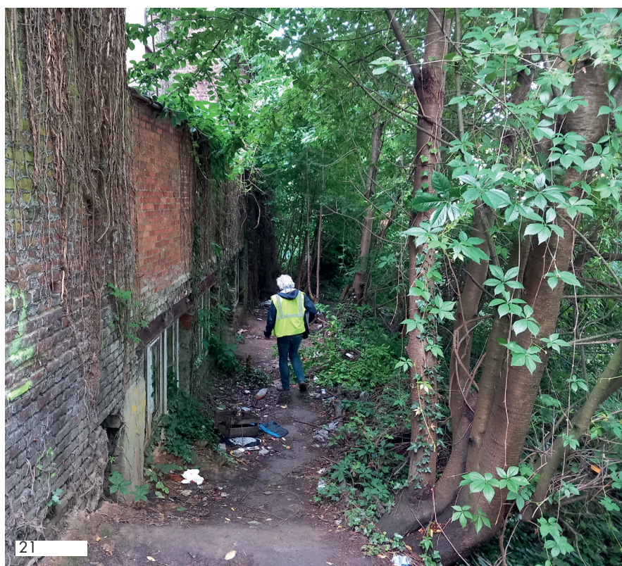
D&C : 06-06-25