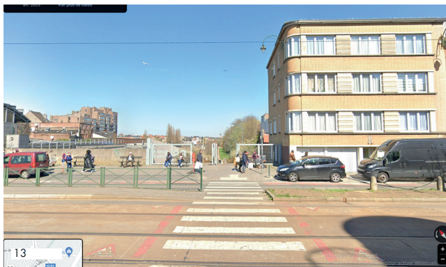
Google Street view